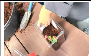
달팽이 키트 만들기